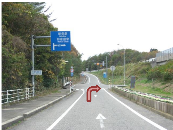
⑤和倉 I C (交差点)