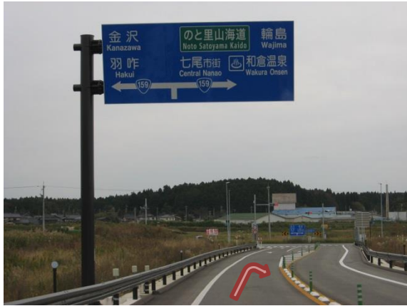
①七尾 I C (交差点)